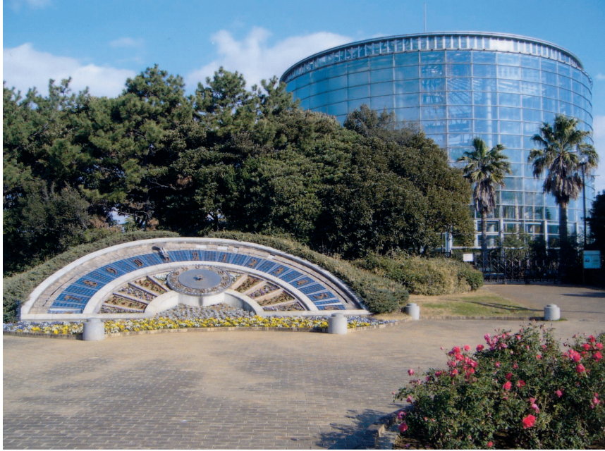
一花の美術館「新春鉢花展(1/5～1/17)」「新春花絵巻(1/5～2/28)」開催中一

福祉を守る！そして目指す！ 「こども」「高齢者」「障がい者」を 大切に作る市政へ