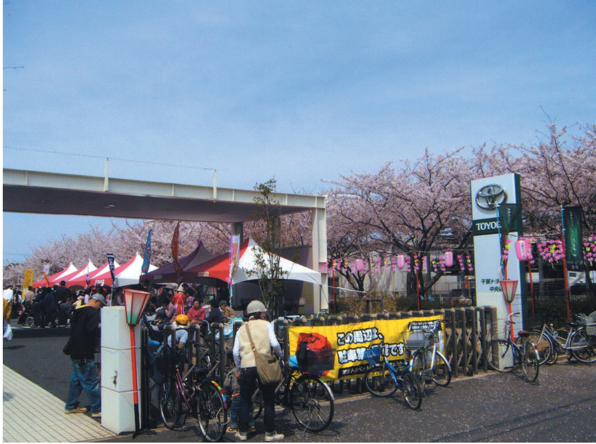
— 稲毛海岸4丁目のお花見風景 —

民主党千葉市議会議員団 布施貴良事務所 〒261-0004 美浜区高洲3-4-12-101 電話 277-1212 ホームページURL http://www.fusemasayoshi.org Eメール info@fusemasayoshi.org